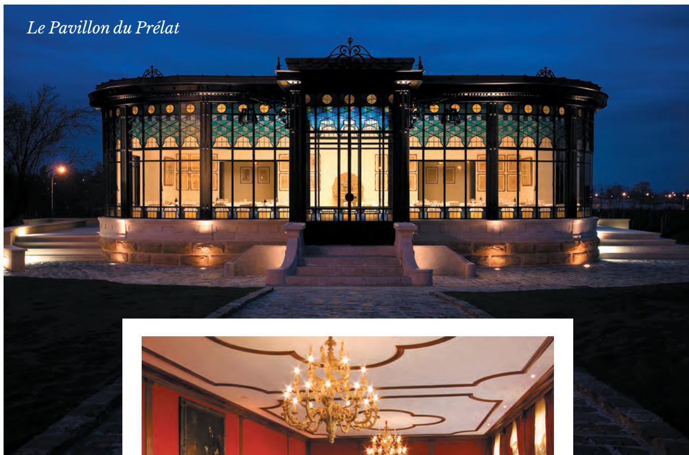
Le Pavillon du Prélat