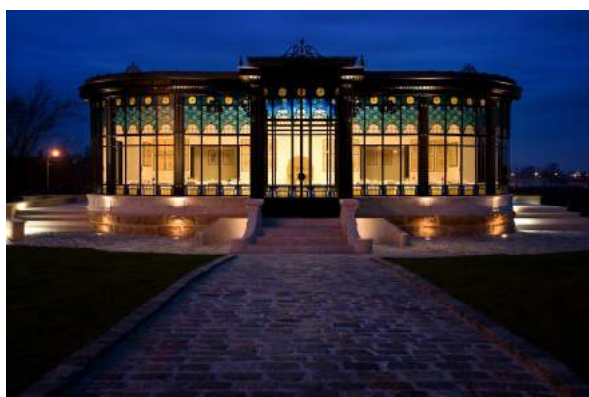
Le Pavillon du Prélat