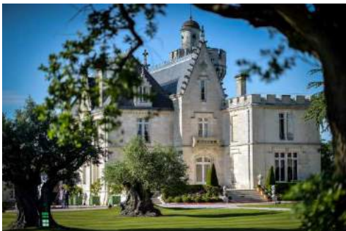
Château Pape Clément