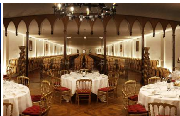
La Salle des Chais