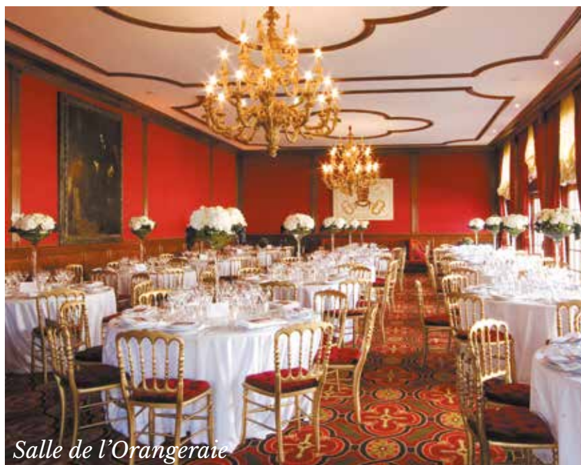
Salle de l'Orangerie